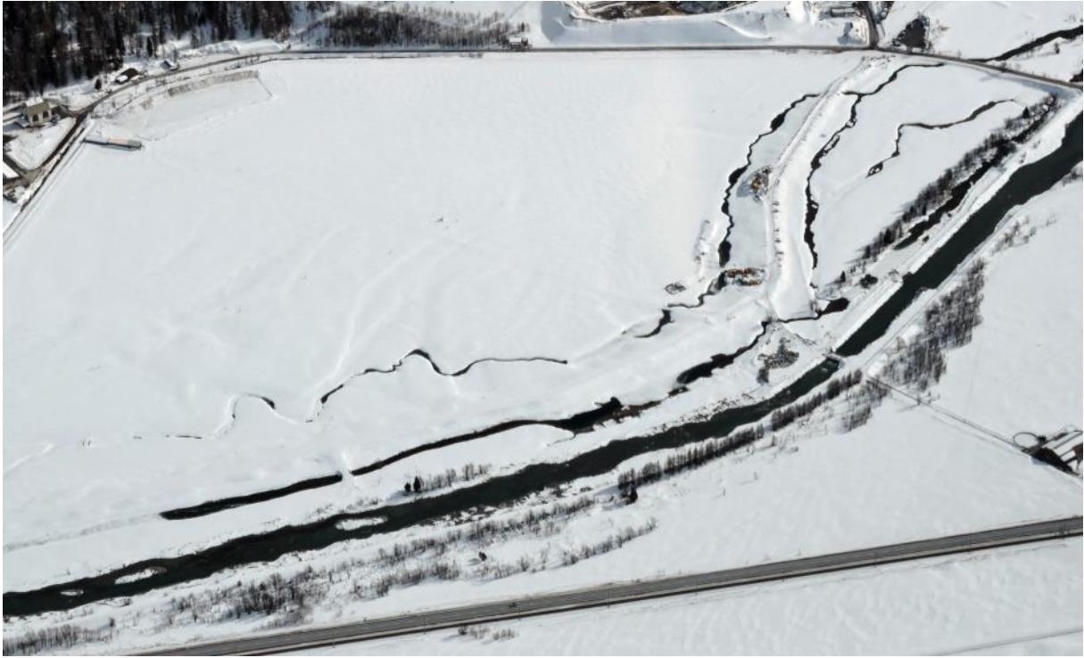
Die Baustelle im Winterschlaf: Nur die nicht vollständig zugefrorenen Binnengewässer sorgen für Abwechslung in der weissen Landschaft (20.2.20).

Noch immer befindet sich die Baustelle im Winterschlaf. Wäre nicht offenes Wasser im Bereich der Binnengewässer sichtbar, würde man in der zugeschneiten Landschaft, von Weitem betrachtet, kaum die Baustelle der 2. Etappe vermuten.