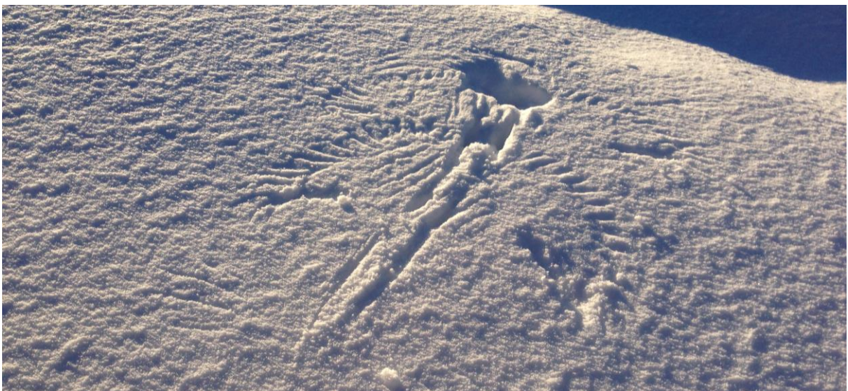
Heimliche Besucher sind die Krähen ja nicht gerade, sie sind oft im Fluge zu beobachten, ihre Spuren im Schnee sind aber seltener.

Trotzdem geht der Winter nicht spurlos an der Revitalisierung vorbei. Oder anders gesagt: Auch auf einer schlafenden Baustelle hinterlässt so Manches seine Spuren. Der Schnee stellt dafür die perfekte Bühne dar, verrät die Anwesenheit von so einigen heimlichen Besuchern und hat selber auch einen faszinierenden Spurenschatz zu zeigen.