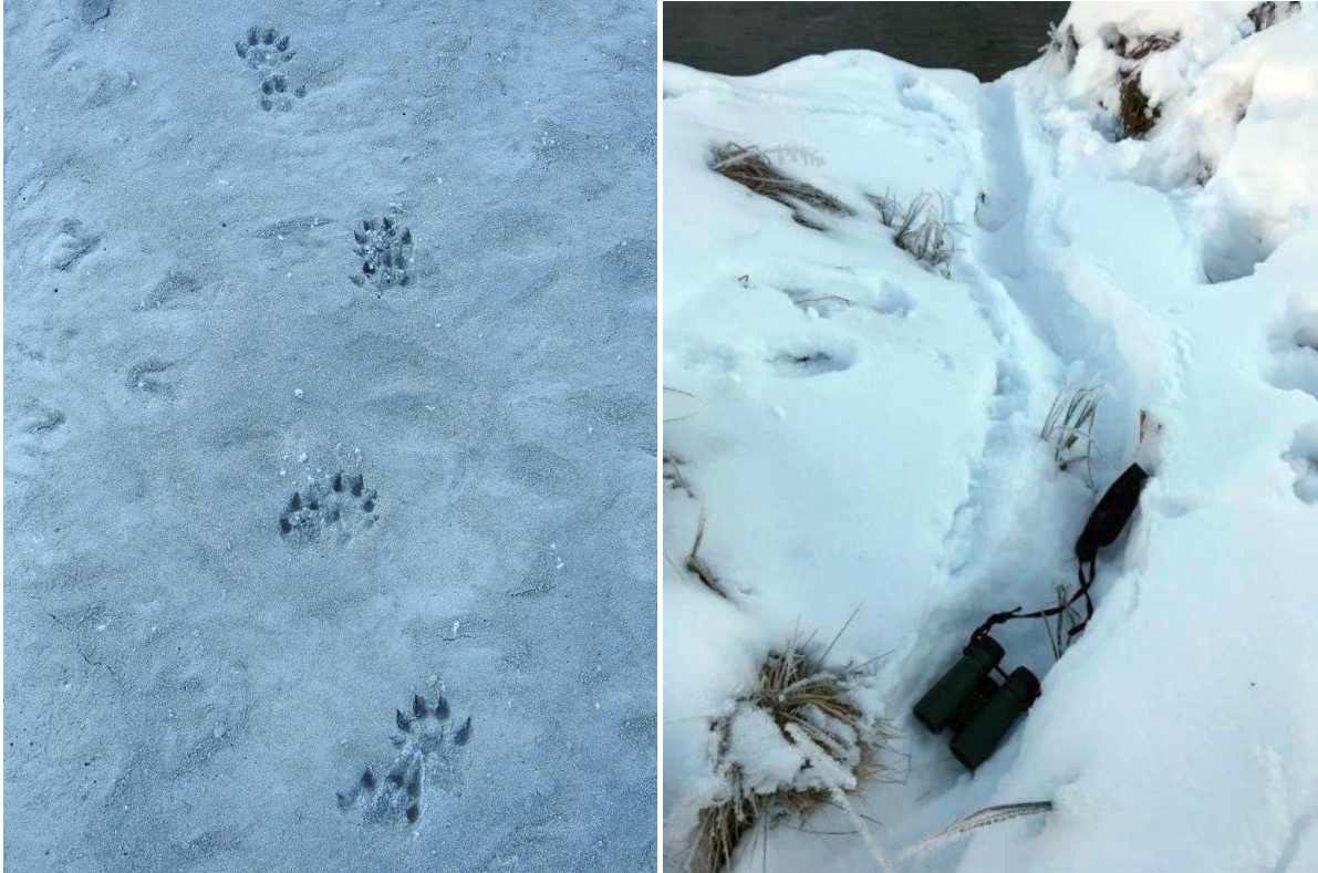
Die Rutsch- oder Schleifspur (rechts) ist gar nicht so einfach von derjenigen des Bibers zu unterscheiden, aber der Pfotenabdruck (links) identifiziert den Fischotter eindeutig.

Doch es sind nicht nur Tiere, auch Wind, Temperaturschwankungen und die Schwerkraft hinterlassen ihre Spurenviefalt. Das kann sogar soweit gehen, dass eine Tierspur plötzlich aus der Schneedecke herausragt.