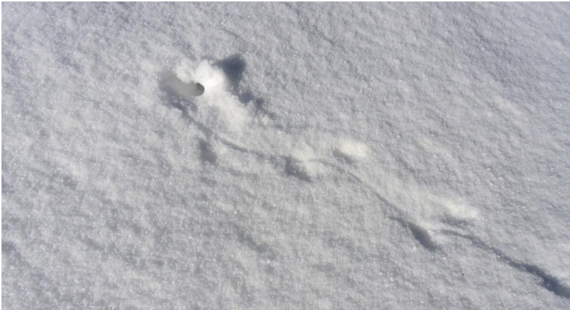
Schon ein bisschen heimlicher ist diese Maus unterwegs. Sie hat hier ihre sichere Höhle verlassen und ihren Weg auf der Schneeoberfläche fortgesetzt. Deutlich ist erkennbar, wie sie ihren Schwanz über den Boden schleift.