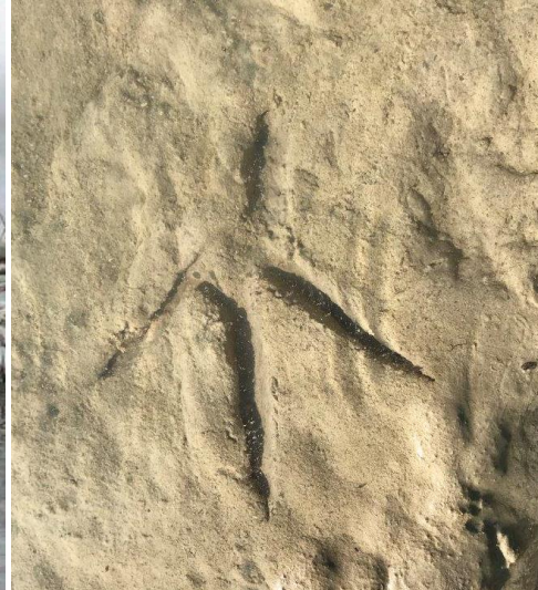
Auch der Graureiher lässt sich oft beobachten, wobei er sich im Winter nicht so häufig zeigt wie im Sommer. Das rechte Bild zeigt seinen Fussabdruck (beide Fotos: T. Wehrli).