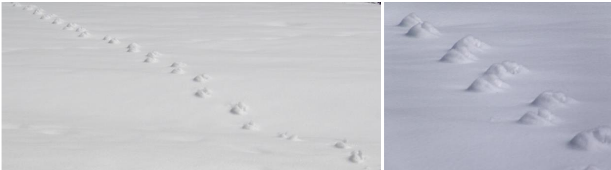
Das ahnungslose Tier, das hier entlang spazierte, drückte den Schnee unter seinen Pfoten zusammen, sodass dieser später vom Wind nicht weggeblasen wurde wie der lockere Schnee darum herum. Jetzt ragt die Spur aus der Oberfläche heraus, es handelt sich also quasi um eine „Negativ-Spur“.

Doch es sind nicht nur Tiere, auch Wind, Temperaturschwankungen und die Schwerkraft hinterlassen ihre Spurenviefalt. Das kann sogar soweit gehen, dass eine Tierspur plötzlich aus der Schneedecke herausragt.