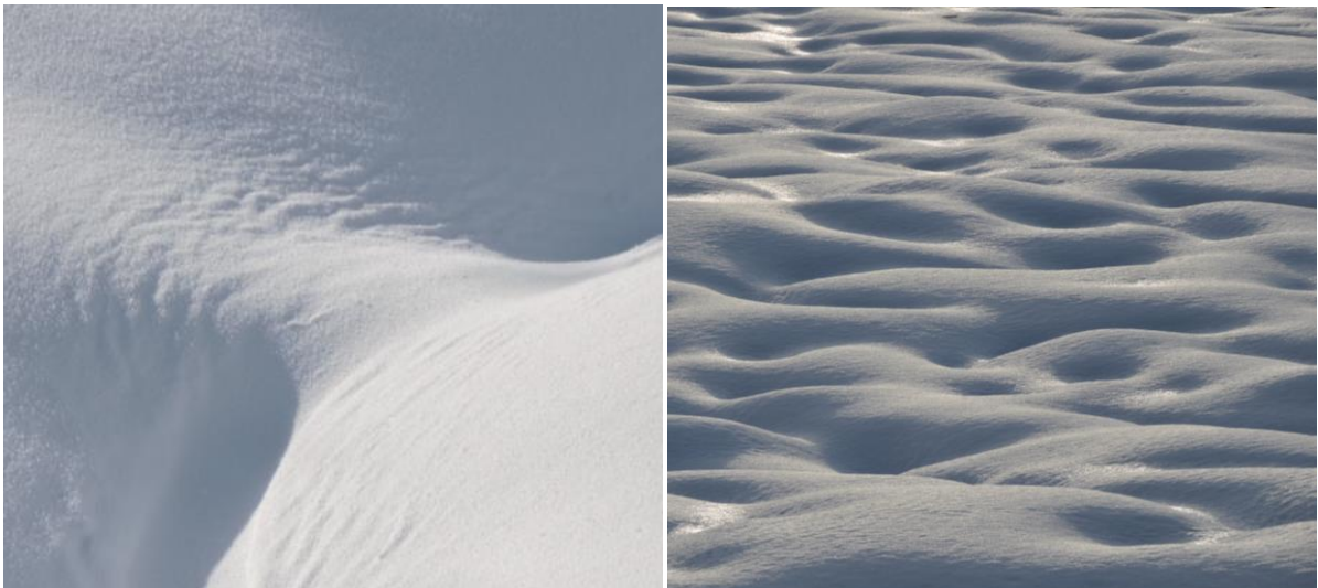
Auch vor Falten ist der Schnee nicht gefeit, da eine Schneedecke, unter dem Einfluss der Schwerkraft, kriecht (links). Je nach eingeschneitem Untergrund kann sogar Cellulitis im Grossformat auftreten, und, um es noch schlimmer zu machen, betont es die tiefstehende Wintersonne auch noch (rechts).

Mit vielem Dank an Thomas Wehrli (Wildhüter) für das zur Verfügung stellen der Fotos! Fotos: T. Wehrli und C. Levy; Text: C. Levy